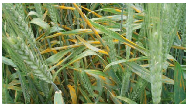
El rovell groc és una de les malalties més severes que pot afectar el blat tou.

□ Normalment les varietats més valorades per la seva qualitat farinera són les que tenen valors de W superiors a 300 (blats millorants); de la relació P/L inferiors a 0,5 (blats extensibles); o bé que tenint uns valors de W mitjans a alts tenen una relació P/L equilibrada.